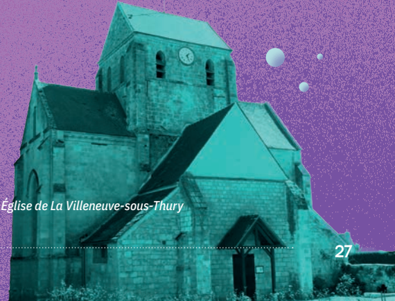
Église de La Villeneuve-sous-Thury